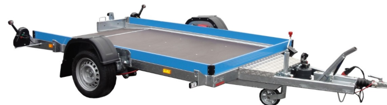
Couleur ridelles au choix dans le RAL