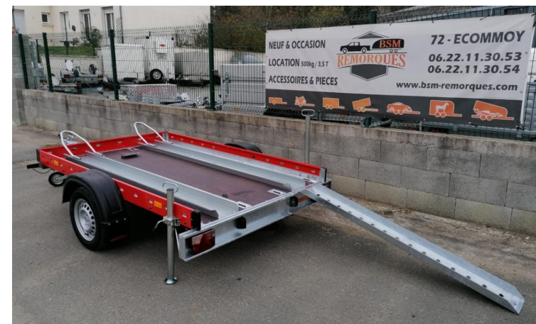
Couleur ridelles au choix dans le RAL