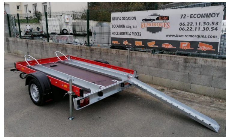
Couleur ridelles au choix dans le RAL